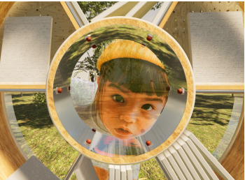
■絵本が落ちないように滑り止めを付けました。

よちよち歩きの1歳のうから、自分で本を読める9歳のうを。みんなが真ん中の「MARU」をのぞいて、向こうに広がる世界を見てみたくなる高さだね。