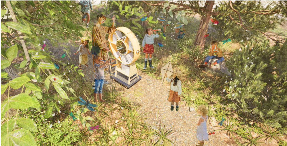
■大人ひとりで移動しやすい重さです（本棚本体 16.0 kg）。

こどもにしか見えない世界の秘密 MARU MARU 絵本を読むと見える世界がくると変わる。小さくて見えなかった虫さんたちの世界。大きくてわからなかった宇宙の物語。想像もしなかったヘンテコな世界まで…。子どもの想像力は無限だ。絵本を手にとるとき、その向こうに広がる青空や芝生、そして友だちと繋がれる本棚。さつと誰も想像しなかった“君だけの世界”が見えてくる。